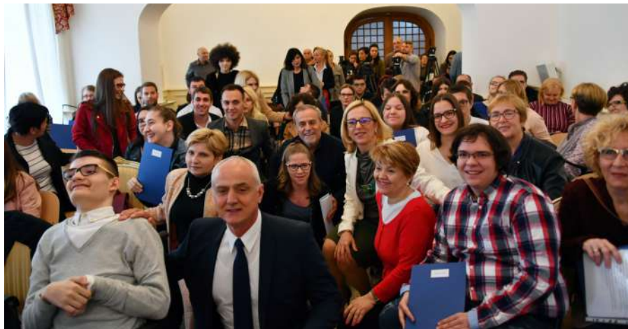
Tablica 8. Stipendija Grada Zagreba za učenike i studente s invaliditetom – sumarni podatci