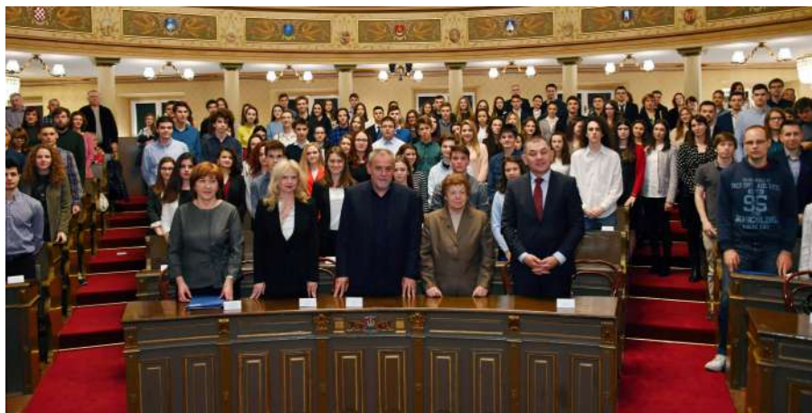
Tablica 2. Stipendija Grada Zagreba za izvrsnost po kategorijama: broj stipendija i iznosi